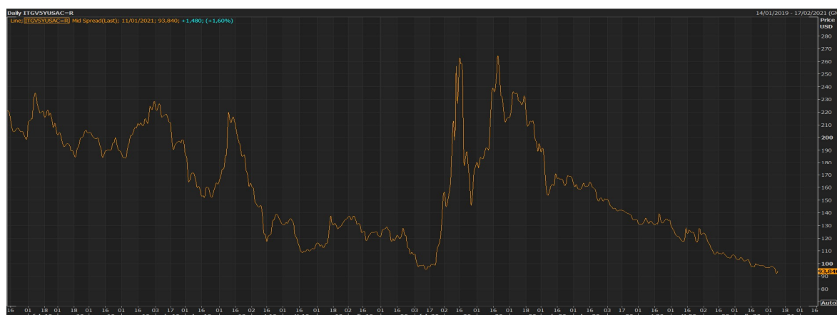
GRAFICO 2: ANDAMENTO CDS REP. ITALIANA A 5 ANNI

In riferimento invece alla rischiosità degli investimenti in titoli obbligazionari, in particolare in riferimento ai titoli di stato italiani, le quotazioni dei Credit Default Swap collegati, nel corso della prima metà del 2020, hanno registrato una crescita significativa, anche per effetto dell'incertezza economica legata alla prima ondata della pandemia da Covid19, ciò ha comportato una maggiore rischiosità collegata al Sinking Fund . Successivamente i CDS sono scesi tornando ai livelli di inizio 2020. Il Rating della Repubblica Italiana è stato confermato a Baa3 da Moody's in data 6 novembre 2020 così come Standard & Poor's ha confermato il rating sovrano ad un livello pari a BBB, in data 23 ottobre 2020.