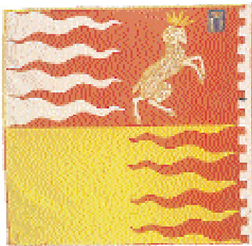
I simboli delle contrade senesi: in alto la contrada della Pantera e la contrada di Valdimontone, nella pagina a fianco la contrada dell'Istrice.