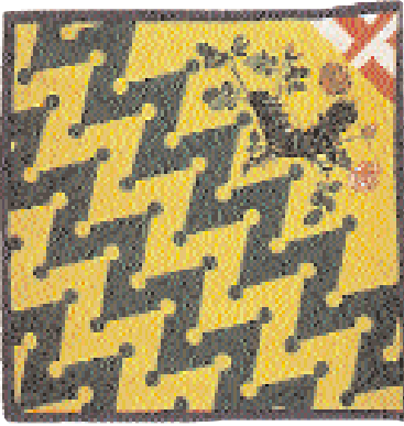
I simboli delle contrade senesi: in alto la contrada del Bruco, nella pagina a fianco la contrada della Giraffa.